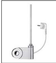
Elektro-Set FKS chrom-silber

Die Variante FKS besteht aus einem elektronisch geregelten Heizstab inkl. Regler (Schutzart IPX4), der am Raumwärmer montiert wird. Länge des Kabels am Heizstab: ca. 1,2 m. Durch Umbau ist der Regler rechts oder links am Raumwärmer montierbar. Ausführung mit Stecker zum direkten Anschluss an einer Steckdose. Der Regler ist in weiß und chrom-silber verfügbar.