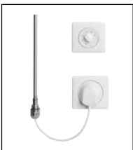
Elektro-Set WKS weiß