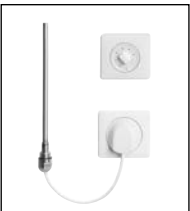
Elektro-Set WFS weiß