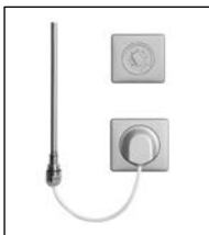
Elektro-Set WKS titan

Die Variante WKS besteht aus einem Wandauslass (Schutzart IPX4), einem elektronisch geregelten Heizstab und dem Regler Standard. Länge des Kabels am Heizstab: ca. 1,2 m. Der Regler Standard wird auf einer Unterputzdose montiert. Die Spannungsversorgung erfolgt in einer für den Regler vorgesehenen Unterputzdose. Leitungsverbindung zwischen Regler und Wandauslass durch bauseitige Verkabelung. Der Wandauslass wird auf einer Unterputzdose montiert. Der Wandauslass und der Regler sind in weiß und titan verfügbar.