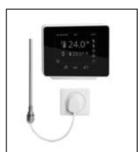
Elektro-Set WRX weiß/schwarz