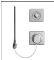
Elektro-Set WFS titan

Die Variante WFS besteht aus einem Wandauslass (Schutzart IPX4) inkl. Funkempfänger, einem elektronisch geregelten Heizstab und dem Regler Funk-Standard. Länge des Kabels am Heizstab: ca. 1,2 m. Der Wandauslass wird auf einer Unterputzdose montiert. Der Wandauslass und der Regler sind in weiß und titan verfügbar. Durch den Batteriebetrieb des Reglers ist dieser Aufputz frei im Raum platzierbar.