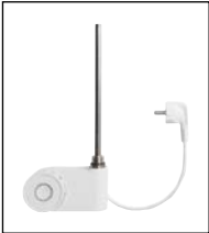
Elektro-Set FKS weiß