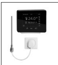
Elektro-Set WRX schwarz/schwarz

Die Variante WRX besteht aus einem Wandauslass (Schutzart IPX4) inkl. Funkempfänger, einem elektronisch geregelten Heizstab und dem Regler Funk-Comfort. Der Wandauslass wird auf einer Unterputzdose montiert. Wandauslass ist in weiß, der Regler in weiß/weiß, weiß/schwarz und schwarz/schwarz verfügbar. Durch den Batteriebetrieb des Reglers ist dieser Aufputz frei im Raum platzierbar. Der Funkregler ist mit einem Touchdisplay ausgerüstet, über welches verschiedene Funktionen programmiert und gesteuert werden können.