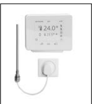
Elektro-Set WRX weiß/weiß