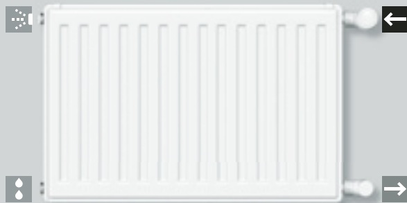
A: Anschluss einseitig