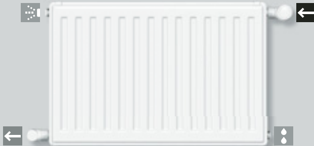
B: Anschluss wechselseitig